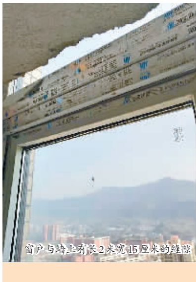
窗户与墙上有长2米宽15厘米的缝隙