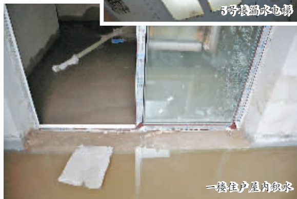
一楼住户屋内积水