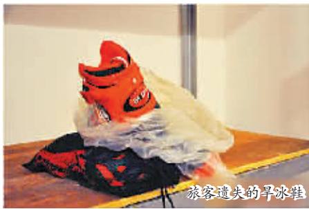
旅客遗失的旱冰鞋