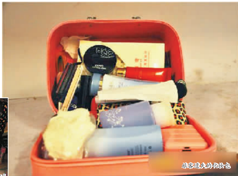
旅客遗失的化妆包