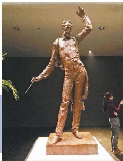
《柴可夫斯基》(青铜锻造)高1.6米 2016年由国家大剧院收藏