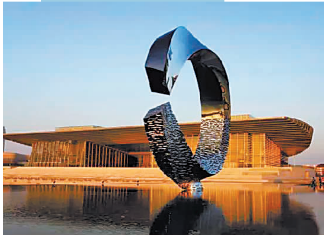
《水上月》(不锈钢)高12.8米 2012年立于天津市文化中心

朱尚熹发出“只要家乡有召唤，我们这些在外面工作的雕塑家都会返回……”这样的感慨，为我们设立了一个课题——达州籍艺术家的回归！