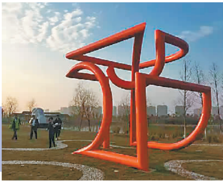
《线走方圆》(钢材喷漆)高5米 2014年立于长沙洋湖湿地公园