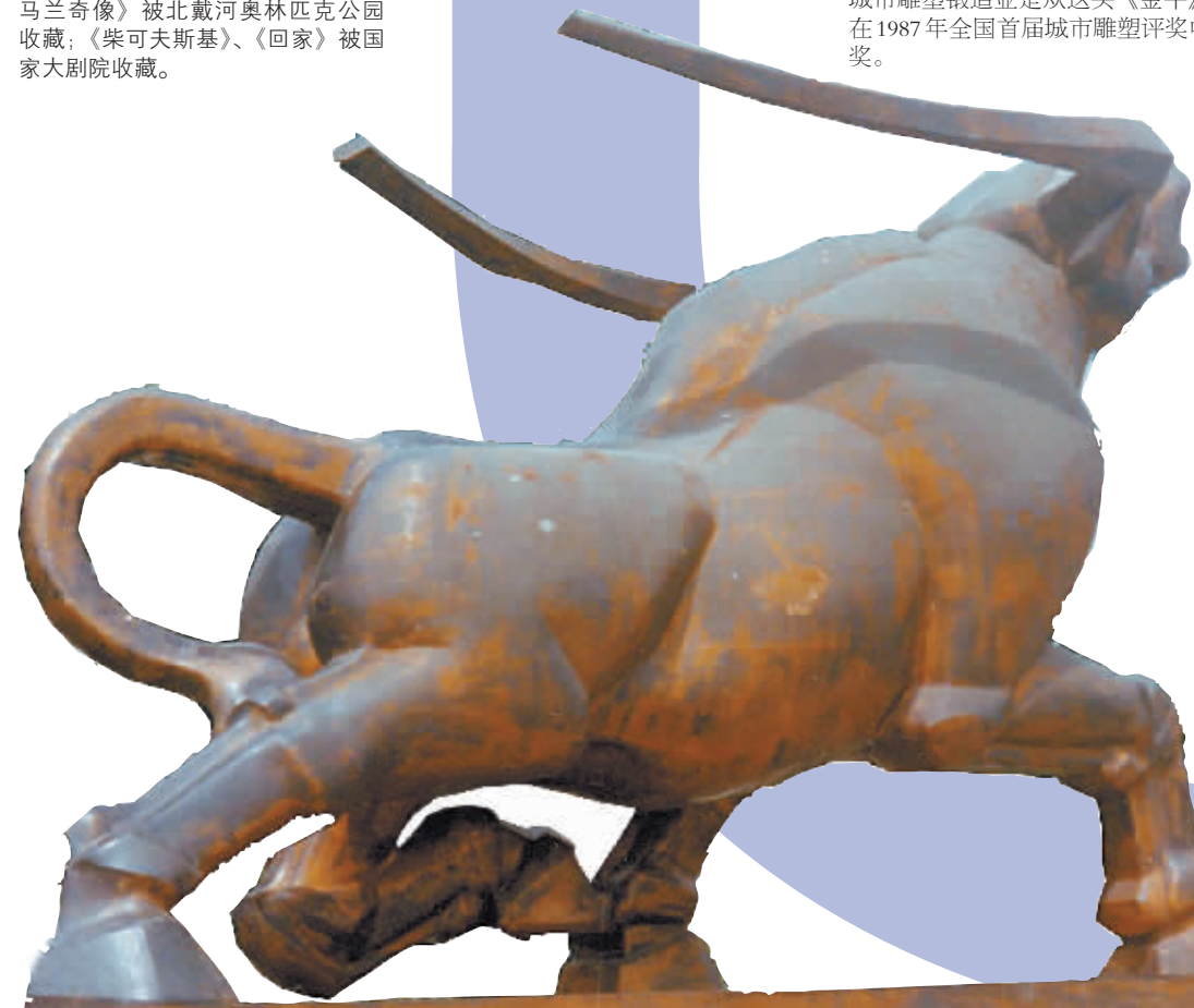
《金牛》(黄铜锻造)350cm 1985年立于成都金牛区

矗立在成都金牛区的标志性雕塑《金牛》是朱尚熹80年代的作品。那是他刚从中央工艺美术学院毕业后完成的，也是他的处女作。当时正值我国城市雕塑发展的初步阶段，该作品是我国最早用黄铜锻造的城市雕塑。毫不夸张地说，成都现在火爆的城市雕塑锻造业是从这头《金牛》开始的。该作品在1987年全国首届城市雕塑评奖中获得了优秀作品奖。