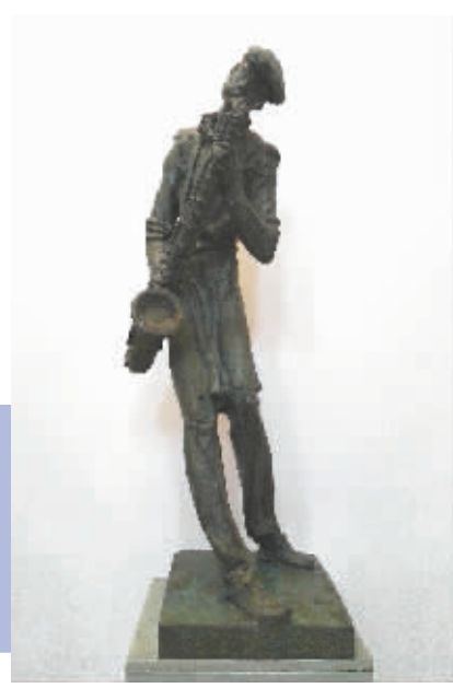
《回家》(青铜锻造)高1米 2014年由国家大剧院收藏