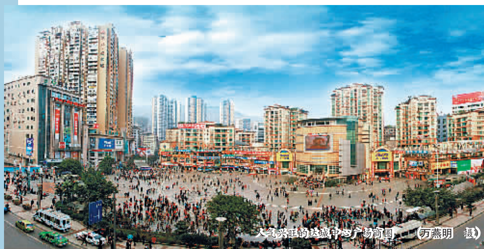
人气兴旺的达州中心广场商圈

今年以来,站在新的发展节点的达州,以“撸起袖子加油干”的姿态,干出了历史上前所未有的发展热度。 1至6月,全市实现GDP752.5亿元,增速由2015年的3.1%、2016年的7.2%提高到今年上半年的8.5%,同比提升1.3个百分点,排全省第8位、上升11位,为近4年来首次超过全省平均水平。 其中,规模以上工业增加值同比增长9.4%、提升2.9个百分点,排全省第14