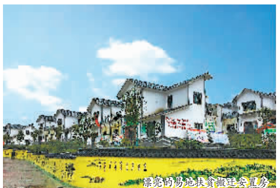
漂亮的易地扶贫搬迁安置房