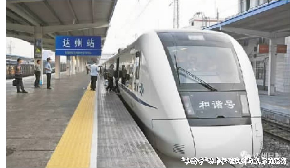
“和谐号”动车驶进达州与成都的距离