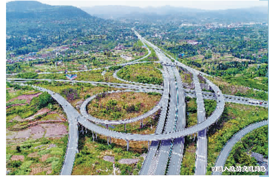
四通八达的交通网络