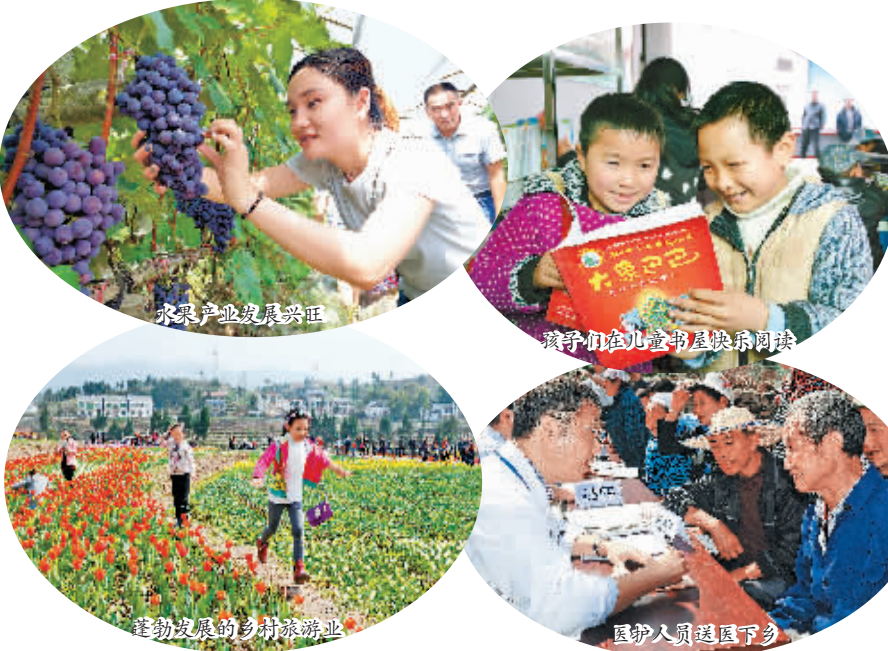
水果产业发展兴旺 孩子们在农家书屋快乐阅读 蓬勃发展的乡村旅游 医护人员送医下乡

今年以来,站在新的发展节点的达州,以“撸起袖子加油干”的姿态,干出了历史上前所未有的发展热度。 1至6月,全市实现GDP752.5亿元,增速由2015年的3.1%、2016年的7.2%提高到今年上半年的8.5%,同比提升1.3个百分点,排全省第8位、上升11位,为近4年来首次超过全省平均水平。 其中,规模以上工业增加值同比增长9.4%、提升2.9个百分点,排全省第14