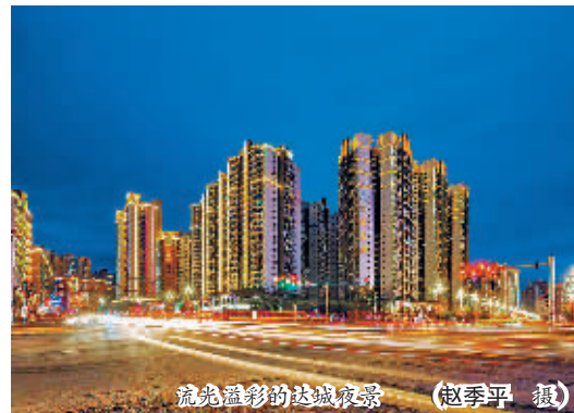
流光溢彩的达州夜景