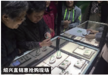
绍兴直销惠抢购现场

抢购地址:达州日报社报业大厦一楼大厅(文轩书店对面) 抢宝热线:0818-2651299(电话预约免排队) 抢购时间:7月8日-16日