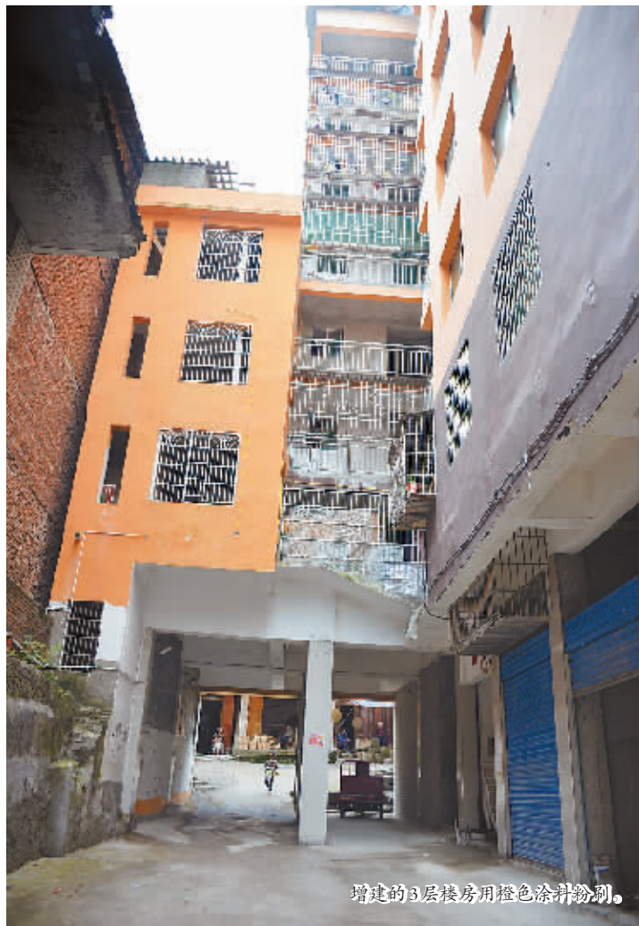
增建的3层楼房用橙色涂料粉刷。