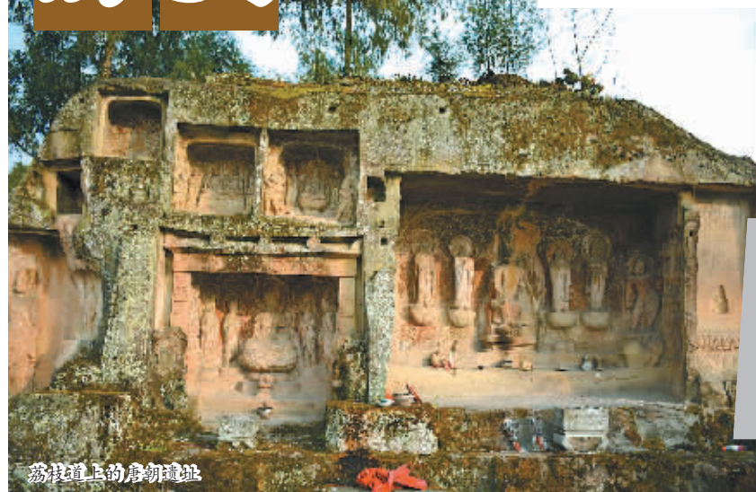
荔枝道上的唐朝遗址

一条条古道,从西安出发,穿越高峻陡峭的秦岭、巴山,最终到达富饶的天府之国。这些曾经无比艰难的道路,如同血脉一般,将长安与巴蜀、中原与西南连接起来。2000多年来,古道上那慷慨激昂、清新婉转、哀怨悲凉的吟唱,组成了一部波澜壮阔的道路史诗。