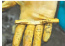
考古工作人员在发掘现场展示刚刚出水的金饰文物