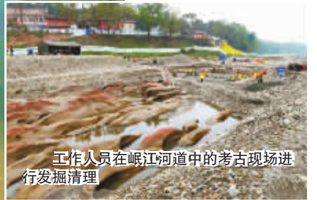
工作人员在岷江河道中的考古现场进行发掘清理