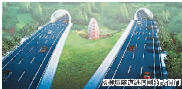
杨柳坪隧道进口削竹式洞门