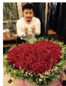
“虽然最近咱俩身体欠佳,但心里是晒着暖暖的阳光的,你的健康与快乐就是我最宝贵的礼物。”