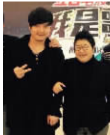
情人节前夕,韩红高调表白:刘洲是我的宝贝