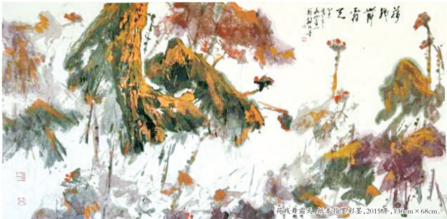
荷残舞霜天,纸本指墨彩墨,2015年,136cm×68cm。