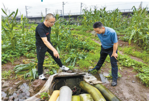
现场查勘堰塞湖排水情况

巴河江陵段作为国家特种鱼类保护区及二级饮用水源保护地,现正值主汛期,降水逐渐增多。在市、区防汛办的统筹指挥调度下,通川区江陵镇党委政府结合地理位置实际情况,与巴河上游平昌县积极协调、沟通,建立联巡、联防机制。