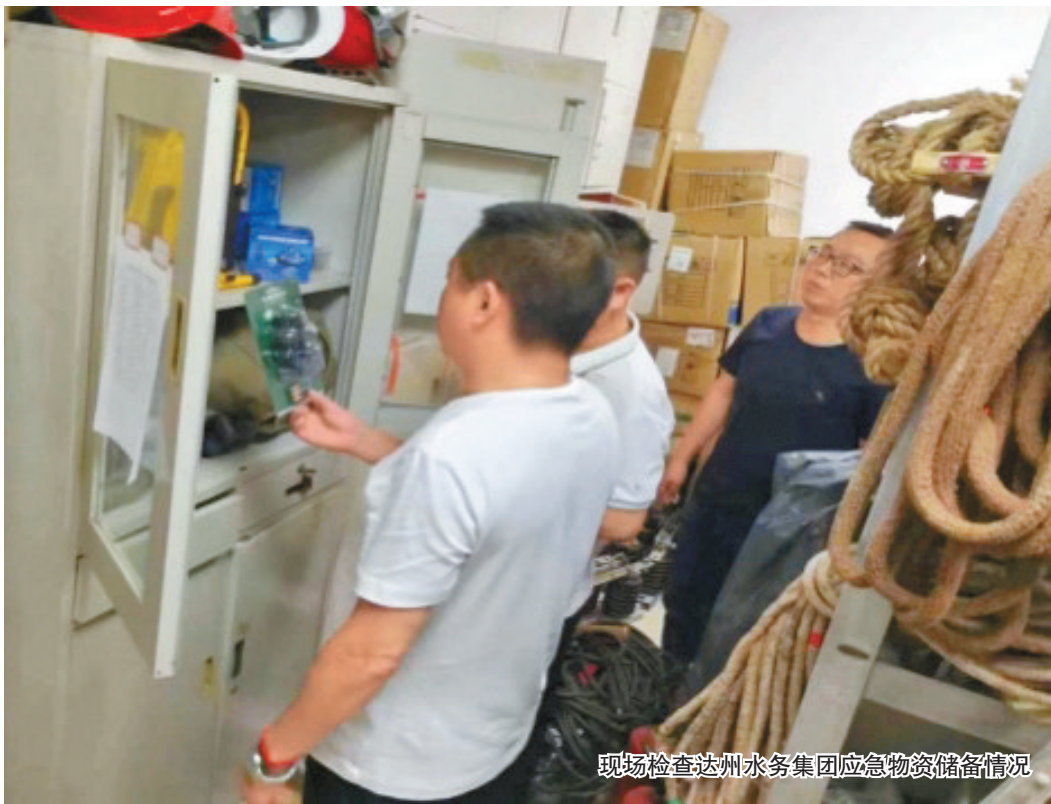
现场检查达州水务集团应急物资储备情况

“防汛物资备齐没有?排水治理工程进展到什么地步了?”日前,驻市国资委纪检监察组到达发实业公司一因弃土场项目形成的堰塞湖进行实地勘察,发现该项目存在风险评估不到位、现场管理不善等问题,现场督促责任单位立即采取措施,消除安全隐患,全力做好防汛备汛工作。