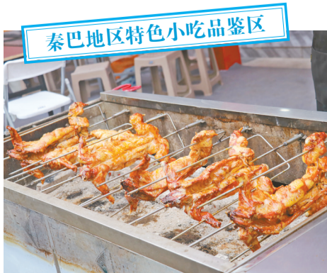
秦巴地区特色小吃品鉴区

不少市民告诉记者,秦巴交易会真是一届比一届精彩,商品五花八门、各式各样,让人来了就不想离开。