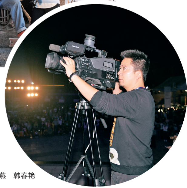
□本报记者 龚其明 谢建荣 汤艳燕 韩春艳