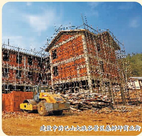
建设中的巴山大峡谷景区桑树坪商业街

本报讯 为实现巴山大峡谷景区2018年9月开门迎客的目标,近日,宣汉县要求各参建单位、部门、企业务必高度重视,迅速到岗到位,倒排工期,抢抓进度,强化监督管理,按照目标任务逐个分解落实。各建设方要卡住时间节点,抓好各项统筹工作,千方百计加快巴山大峡谷项目建设,坚决实现按期开门迎客。 据了解,目前,巴山大峡谷景区内环线风貌打造全面结束,内环线观景平台已完成施工图和施工方案设计;渡口风情小镇游客中心主体工程已完成,正在内部装修;巴人山寨81栋房屋风貌打造已全面完成,样板房室外铺装、绿化全面结束;游客接待中心正在刷外墙涂料;停车场已完成水稳层铺设,即将进行地砖铺装;中心广场正在进行地砖铺装;狩猎场接待中心正在进行地基基础浇筑,7000亩猎场围栏已安装完毕。罗盘顶养身养心区灵官庙左右偏殿、文昌殿主体完成;关楼已完成基础平台施工。 同时,景区内栽植绿化乔木2.7万余株,重要节点绿化覆盖面积达2000余亩,形成了“处处有景,四季花开”的格局。