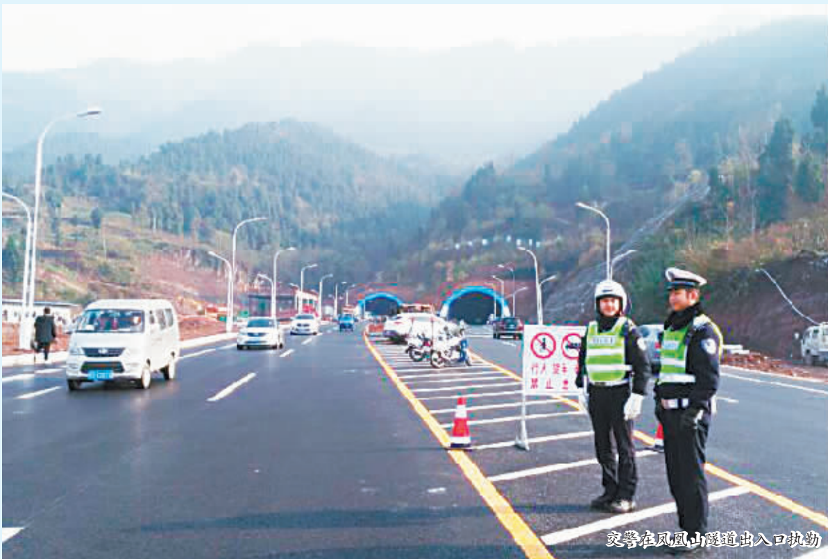
交警在凤凰山隧道出入口执勤

为确保我市“两会”期间交通有序,给代表委员和市民出行营造更好的道路交通环境,市交警直属一大队提前制定管控措施,延续当前管理的高压严管态势,继续加强对客运车辆、危化品车辆实施逐车检查,严厉查处车辆超员、超速、疲劳驾驶等各类交通违法行为和隐患,确保行车安全。