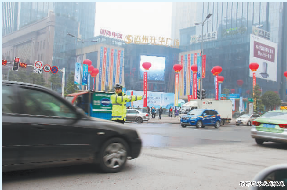
保障道路交通畅通

为了让“两会”期间市民出行更畅通,巩固良好道路交通环境。市交警直属二大队再接再厉,持续加强路面管控力度,全力净化道路交通秩序,扎实做好“两会”期间交通安全管控工作,为群众出行创造更好的交通环境,更加有效地确保辖区道路交通安全畅通。