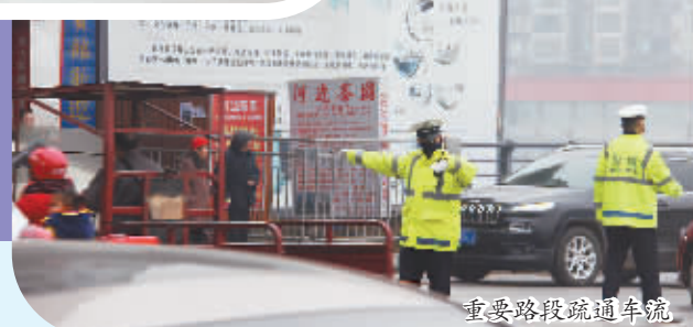
重要路段疏通车流