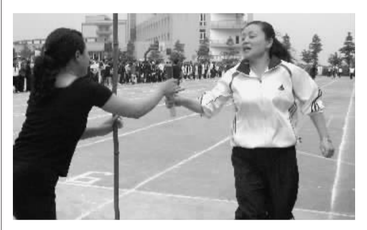
4月24日—27日,大竹县教育系统“庆五一,迎奥运”教职工运动会在大竹中学新校区隆重举行,来自各学区的400多名教师参加了篮球、中国象棋、迎面接力等多个项目的角逐。

那所学校办学地址没变,校长没变,为什么学校的校名竟变了呢?!针对这所学校频繁改换校名一事,一位曾在该校工作的老师笑着说:“这所学校经常出事情,要么食堂出问题,要么学生走丢了,要么乱收学生费用,被新闻媒体曝了好几次光,基本上是曝光一回学校就改了一回名字。”