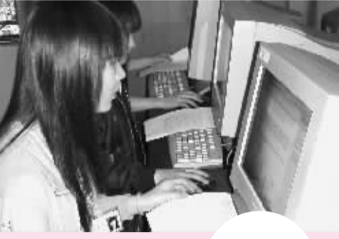
选手正在进行计算机操作。

为展示我市中等职业学校电工电子与计算机应用专业的办学成果,引导学校加强对学生的实用技能训练,由达州市教育局、达州市劳动和社会保障局主办的“达州市中等职业学校电工电子技术类学生技能大赛”暨“2008年达州市中等职业学校计算机技能