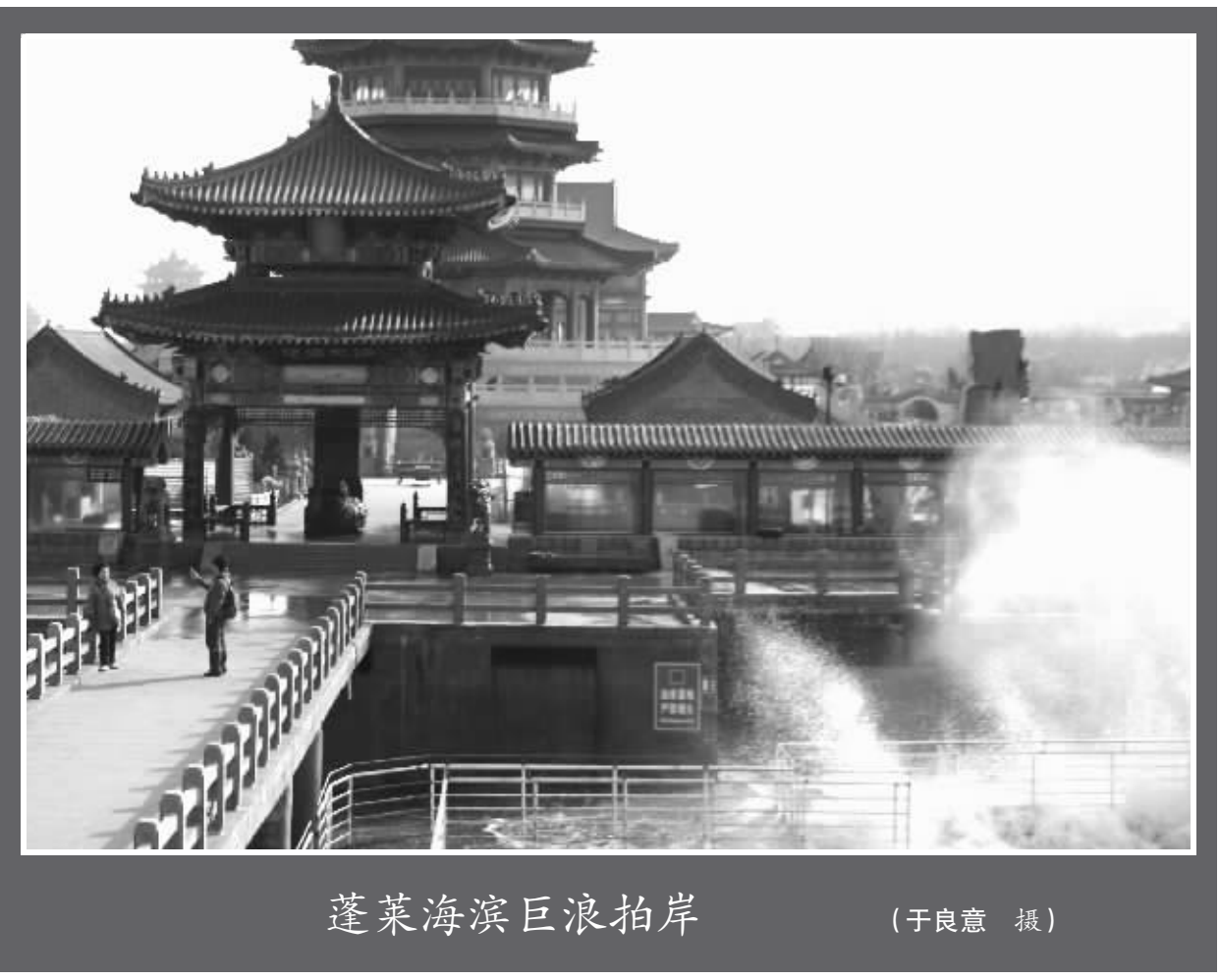
蓬莱海滨巨浪拍岸