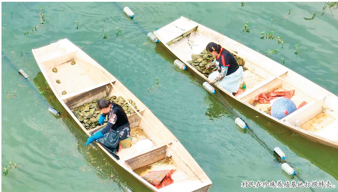
村民在珍珠养殖基地打捞蚌壳。

本报讯(记者 杨鹰 刘强 摄影报道)仲夏时节,开江县任市镇的珍珠蚌苗孵化基地里,一派忙碌景象。工人们正专注地为新到的蚌苗进行微创“插片”手术:撬开蚌壳,剪下两侧裙边,经撕膜、消毒