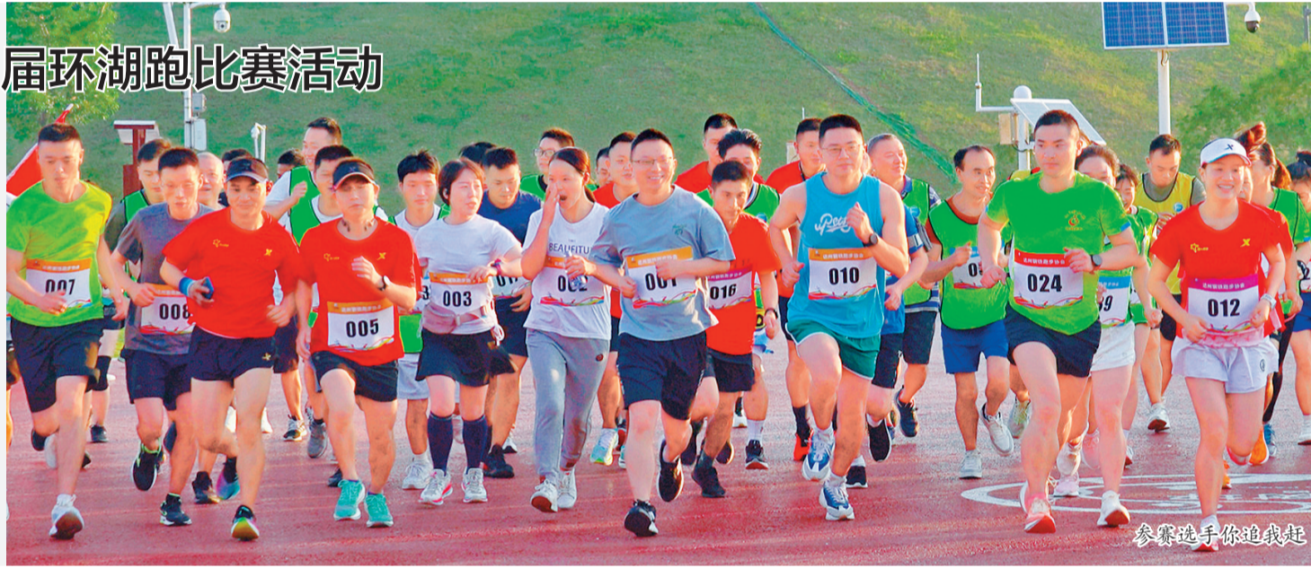
参赛选手你追我赶

比赛中,参赛选手甩开臂膀,你追我赶,长长的赛道上,大家用努力的汗水和坚强的意志,跑出了钢铁工人积极进取的精神风貌。