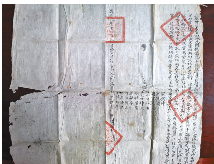
光绪年间的一张地契

“因为古籍具有收藏价值,我们的收集过程很困难,不少古籍到馆都出现了不同程度的损坏。”该馆负责人表示,希望更多群众可以认识到古籍保护的重要性,目前,他们正着手收集更多古籍,然后送至专业修复人员处,待修复后实现古籍电子化。