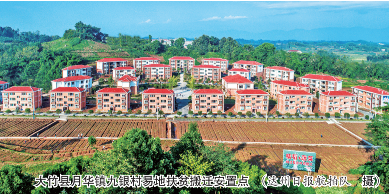
大竹县月华镇九银村易地扶贫搬迁安置点

市发展改革委作为市委、市政府的参谋助手，始终坚持想大事、谋大事、议大事，时刻置身于全国全省大背景、大格局中审视探索自身定位，集中精力研究推动事关达州全局和长远的重大事项。 2018年，推动了一大批重大事项取得突破。老区振兴发展方面，谋划60余个重大项目、总投资近百亿元，计划通过3—5年努力，探索一条革命老区全面建成小康社会、加快实现现代化的新路子；天然气开发利用方面，《国家天然气综合利用示范区建设实施方案》已报国家能源局评审。天然气实现增产增供，产量达99亿立方米，消纳量达15亿立方米；铁路枢纽建设方面，经过努力争取，“加快成南达万高铁建设”写入省委全会决定；区域协同发展方面，川东北经济区、达成合作、达渝合作、达陕合作全面推进，达万协同发展纳入川渝合作行动计划，写入省委“一干多支、五区协同”