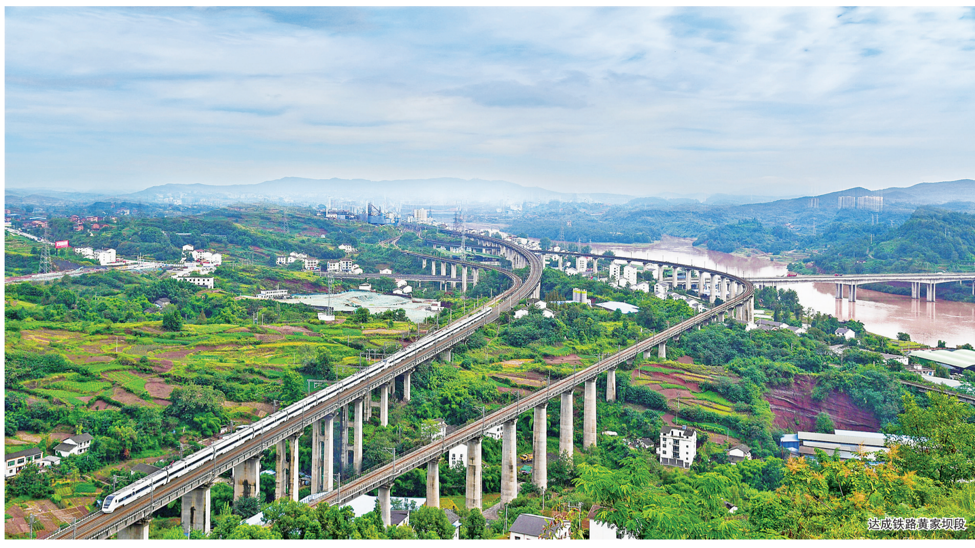
肖扬 蒋继春 邱霞 刘欢 文/图

风雨濯征程，巴渠满堂春。近年来达州发展改革工作，呈现一幅幅引人入胜的动人画面，奏响一曲曲豪迈奋进的时代乐章。 伴随达州加快发展、转型发展，达州市发展改革委在市委、市政府的坚强领导下，坚持围绕中心服务大局、高点站位追求卓越，突出抓好重大政策、重大规划、重大项目落地落实，统筹推进发展改革各项工作，推动经济社会发展取得了新成就，绘就了美丽气都新画卷。 ——成功筹办全国易地扶贫搬迁现场会，得到中央领导的高度肯定；“双靠近三融合”模式被列为国务院第五次大督查发现的典型经验做法…… ——创建国家天然气综合利用示范区，历时6年终获国家能源局批复支持；创新企地天然气合作开发机制，获得省委主要领导批示肯定…… ——融入“一带一路”，长江经济带加快推进，达州全域纳入三峡生态经济合作区调研范围，参与提出的建设四川东出北上综合交通枢纽、川渝陕结合部区域中心城市、秦巴地区综合物流枢纽等被纳入省委战略实施规划…… ——事关达州长远发展的成南达万高铁前期工作加快推动，即将开工…… 2017年，全市GDP增长8.2%，增速近五年来首次进入全省前10位；2018年，全市GDP增长8.3%，继续保持高位增长…… 这一串串亮闪闪的数字，一个个沉甸甸的荣誉，无不勾勒出达州市发展改革委忠实履职、真抓实干、敬业奉献的精彩答卷。