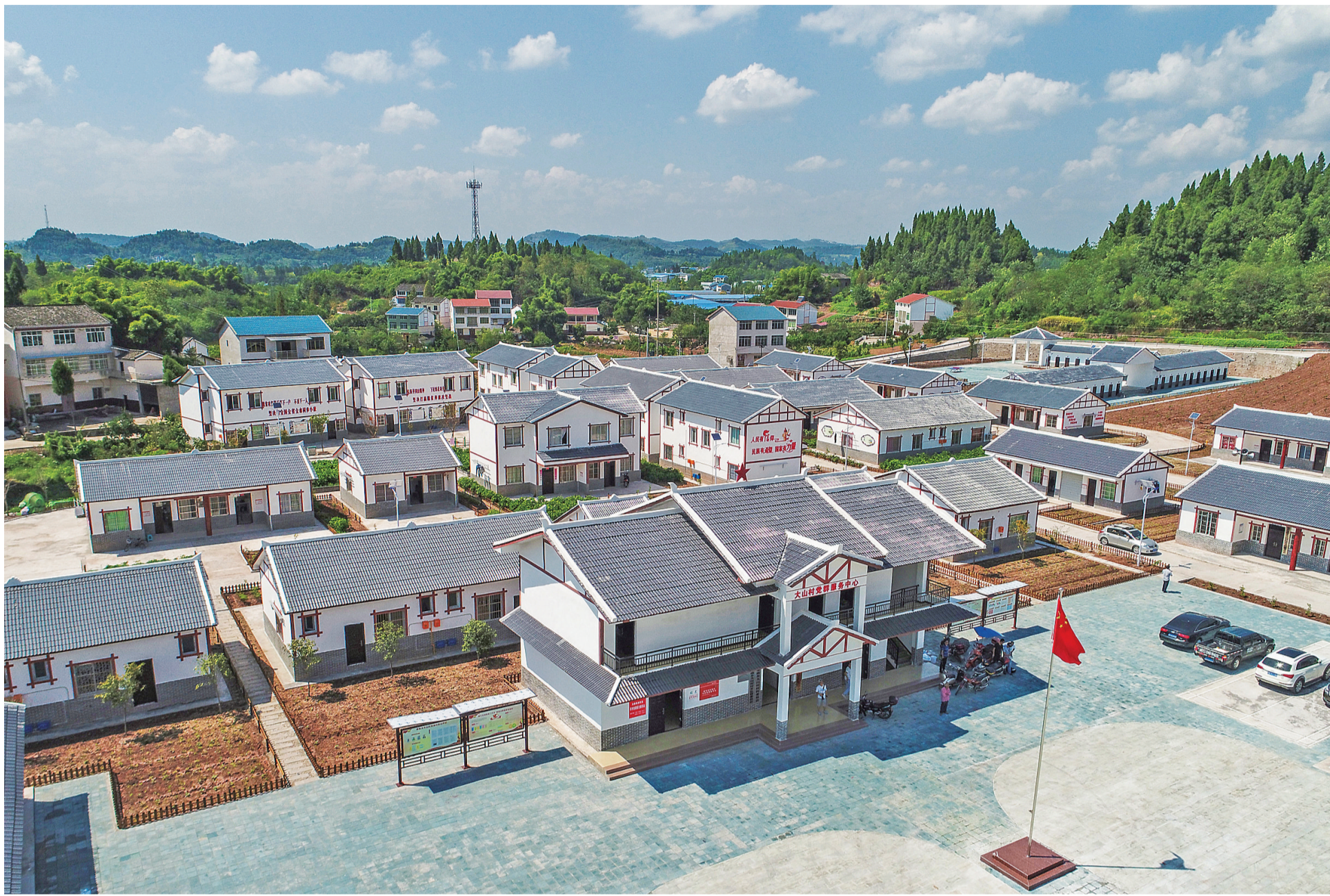
渠县渠南乡大山村易地扶贫搬迁集中安置点。

作为新代表,达川区万家镇三星村党支部书记蒋克、万源市庙坝乡礼壶村村委会委员李蓉同样十分关心农村的扶贫和发展问题。这些天,他们利用空闲时间,抓紧完善建议意见。蒋克建议,文化部门多开展文化下乡活动,通过丰富多彩的文化活动,引导农民自强不息、感恩奋进、脱贫奔小康。李蓉建议,省上多出台一些关于贫困山区农业产业发展的扶持政策,支持农业转型,提高农民收入,助力脱贫攻坚。