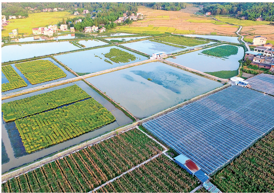
开江稻田+大闸蟹生态养殖基地。