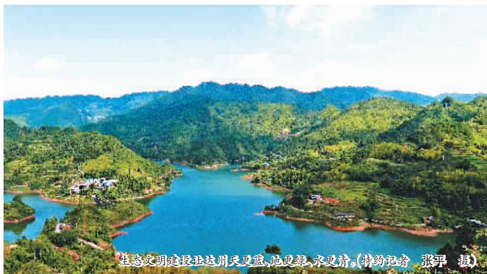
生态文明建设让达州天更蓝、地更绿、水更清。