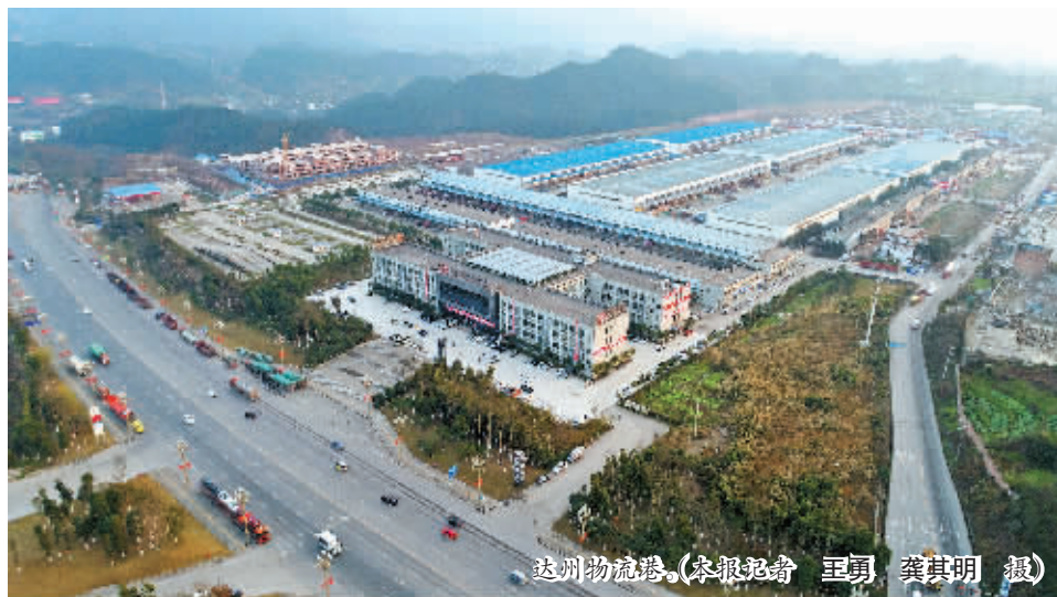
达州物流港。