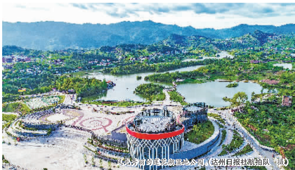
风光秀丽的莲花湖湿地公园。